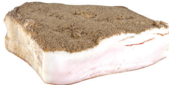
801.1 | Lardo stagionato sottovuoto kg 4 801.2 | Lardo stagionato sottovuoto kg 1 802.1 | Lardo stagionato in tranci sottovuoto gr 400

Per la salatura in apposite vasche , utilizziamo tagli anatomici di 6/7 cm di altezza , uniformemente cosparsi di erbe aromatiche . A seguito di una stagionatura di almeno 6 mesi , il prodotto è pronto per essere confezionato in tranci sottovuoto di varia pezzatura, da 4 kg fino a 400 grammi.