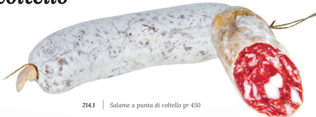
214.1 | Salame a punta di coltello gr 450

La denominazione di questo salame atipico, suggerisce l'accurata cubettatura delle carni, ottenuta con un coltello meccanico , processo meno “stressante” rispetto alla macinatura. L' impasto particolarmente lento , l'insacco in budello naturale e la stagionatura di almeno 40 giorni , conservano intatto il sapore gentile e genuino delle carni impiegate.